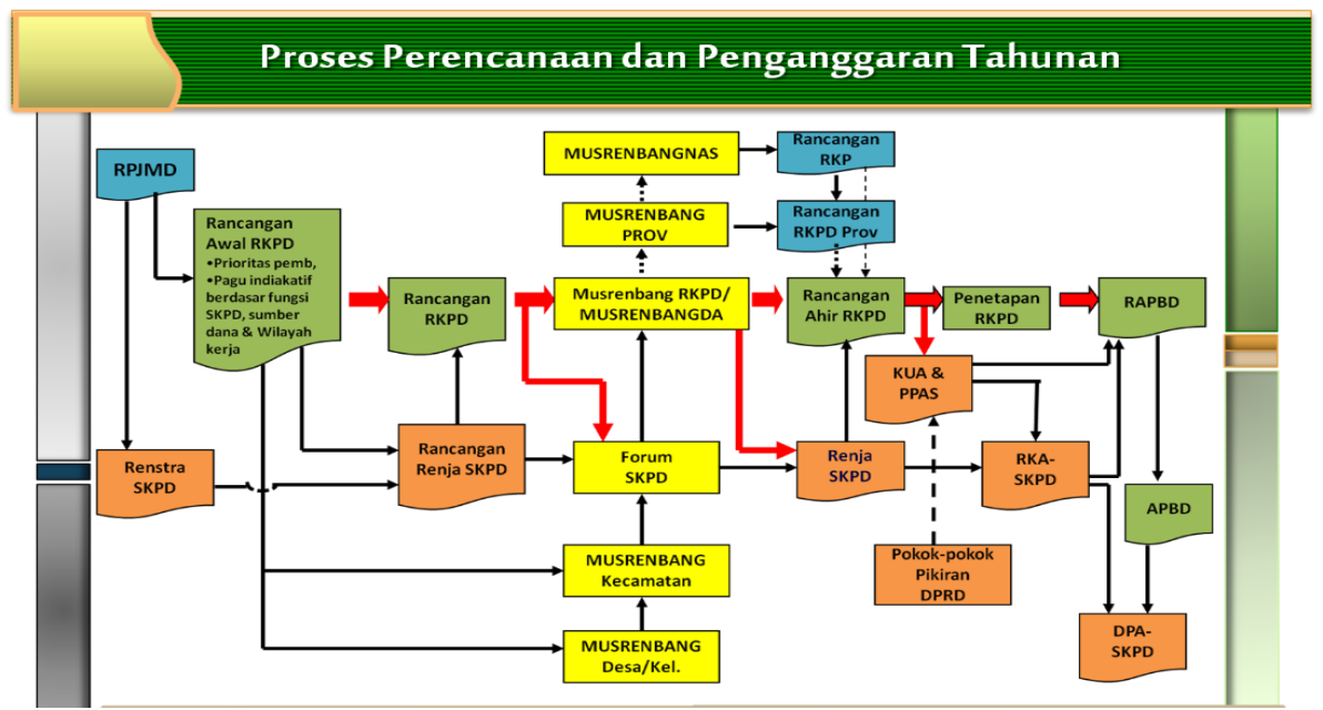
Gambar 1.1 Hubungan Renja Perangkat Daerah dengan Dokumen Perencanaan Lainnya

Renja Perangkat Daerah merupakan dokumen perencanaan Perangkat Daerah untuk periode satu tahun. Renja Perangkat Daerah menjadi pedoman Perangkat Daerah dalam Menyusun RKA Perangkat Daerah. Proses penyusunan Renja Perangkat Daerah dilakukan secara simultan dan sifatnya saling memberi masukan dengan proses penyusunan RKPD. Secara lebih rinci, hubungan Renja Perangkat Daerah dengan dokumen perencanaan lainnya dapat dilihat pada gambar 1.1